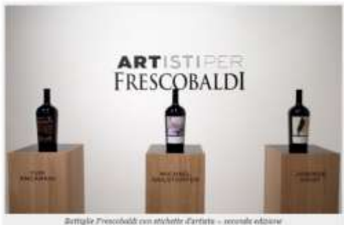
Bottiglie Frescobaldi con etichette d'artista - recente edizione

Stampa da Luca Brandi | lunedì, 21 marzo 2016 | Print | PDF | Email