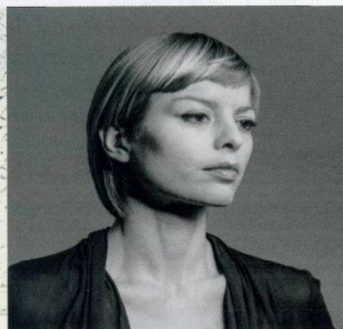
JORINDE VOIGT Nella sua opera, le macchie di colore incontrano linee vettoriali e geometrie misteriose.